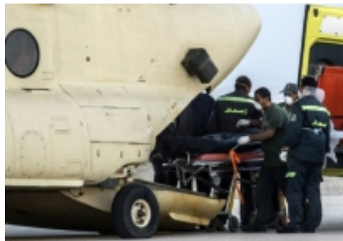
Crash d'un avion russe en Egypte: l'enquête démarre, les recherches s'élargissent