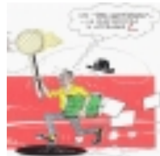
Etretat : dessin de presse, dessin à risque