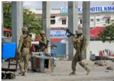
Somalie: au moins 12 morts dans l'attaque d'un grand hôtel de Mogadiscio