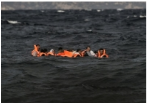
Grèce: nouveau naufrage en mer Egée, 11 migrants morts dont 6 enfants